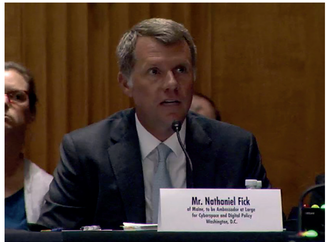
Audition au Congrès de Nathaniel Fick, ambassadeur des États-Unis pour la politique numérique et le cyberspace

Au cours de l'été, une approche holistique de la diplomatie numérique a pris de l'ampleur grâce au communiqué de l'UE sur la diplomatie numérique et à la nomination de l'ambassadeur des États-Unis pour le cyberspace et la politique numérique . D'autres pays élaborent des stratégies de politique étrangère numérique et créent des structures institutionnelles pour relever les défis de la diplomatie numérique. De plus en plus de pays vont rejoindre cette tendance.